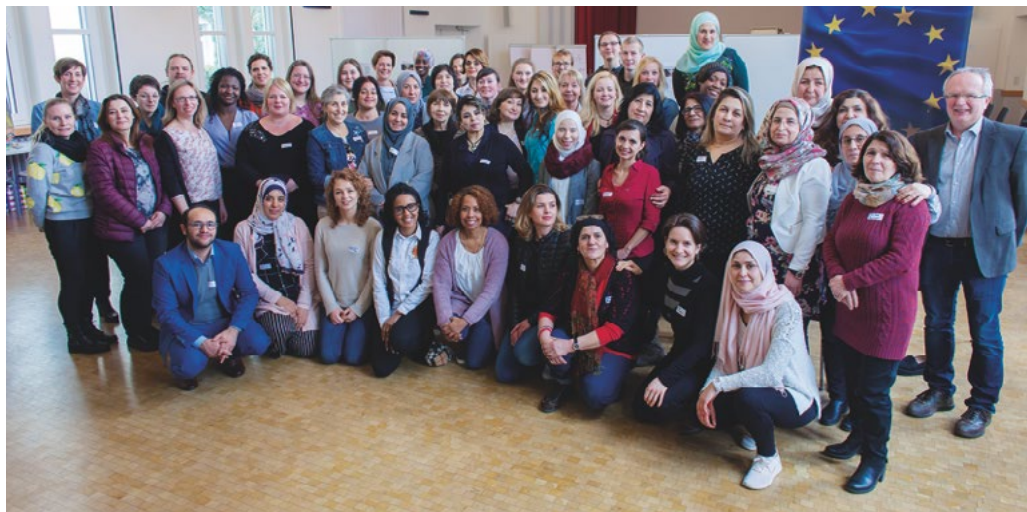
Im Frühjahr trafen sich die Projektmitarbeitenden und die Teilnehmerinnen mit weiteren Gästen zu einem Impulstag in Köln. Nach einem musikalischen und künstlerischen Vormittag konnte jede/r viele neue Eindrücke und Ideen für den beruflichen Alltag mitnehmen.