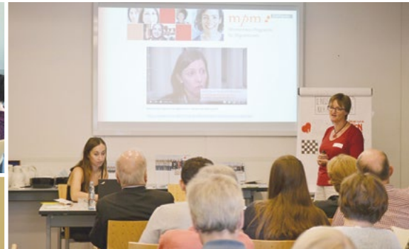
Spannende Impulse und engagierte Arbeitsgruppen prägen den Peer-to-Peer-Austausch.

Alter, Familienstand oder Geschlecht. In Peer-Jobpatenschaften unterstützen beispielsweise früher Zugewanderte neu Angekommene bei der Orientierung auf dem Arbeitsmarkt, junge deutsche Auszubildende geflüchtete Auszubildende oder Mütter, die bereits Kindererziehung und Beruf vereinbaren, geflüchtete Mütter, die einen vergleichbaren Weg gehen wollen. Bei diesem Matching-Verfahren von Mentee und Jobpatin sollen also gezielt Aspekte wie Alter, Geschlecht und Lebenssituation berücksichtigt werden.